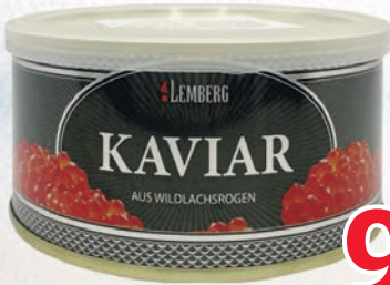
KAWIOR Z ŁOSOSIA GORBUSZA 300 G 289502