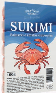
PALUSZKI SURIMI 100 G 675098