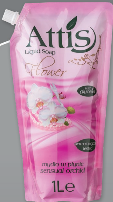
ATTIS MYDŁO 1 L ZAPAS • dwa rodzaje 737994