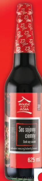
SOS SOJOWY 625 ML • ciemny, jasny 954229