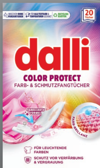
DALLI CHUSTECZKI DO PRANIA 20 SZT., 15 SZT. • wybrane rodzaje 702265