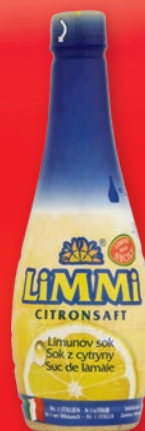
SOK LIMMI 500 ML • z cytryny, z limonki 463508