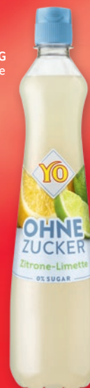
SYROP YO 700 ML 735081