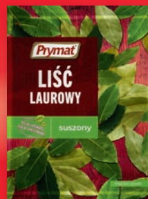
PRZYPRAWY JEDNORODNE 6-30 G • wybrane rodzaje 760647