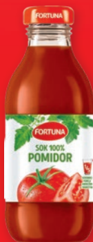
SOK WARZYWNY FORTUNA 300 ML • butelka szklana • wszystkie rodzaje 572482