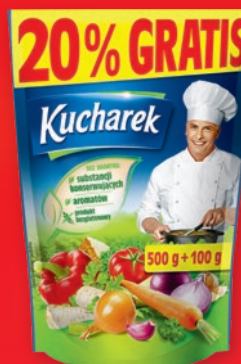
KUCHAREK 500 G 990933