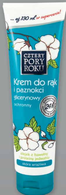
CZTERY PORY ROKU KREM DO RĄK I PAZNOKCI 110 ML, 130 ML • wszystkie rodzaje 594263