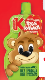
MUS KUBUŚ 100 G • wszystkie rodzaje 465697