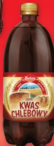
KWAS CHLEBOWY BETEX 1 L • + kaucja 0.50 zł 649233