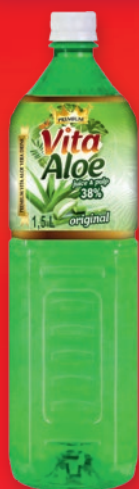
NAPÓJ VITA ALOES 1,5 L 626601