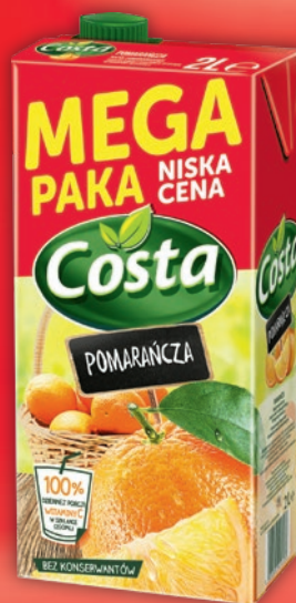
NAPÓJ COSTA 2 L • wszystkie rodzaje 385096