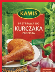
MIESZANKI PRZYPRAW 8-35 G • wybrane rodzaje 563894