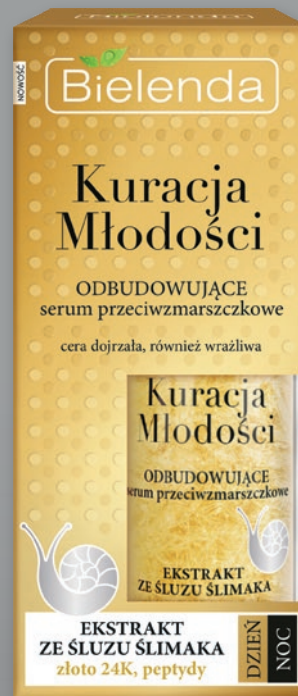
BIELENDA SERUM 30 ML 553964