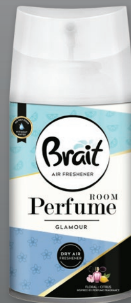
BRAIT ODŚWIEŻACZ 250 ML • wybrane rodzaje 962979