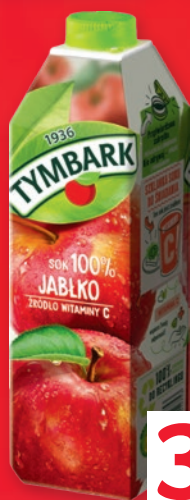
SOK JABŁKOWY TYMBARK 1 L 474168