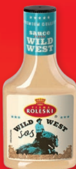
SOS 290-370 G • wszystkie rodzaje 338536