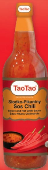
SOS CHILI 900 G • słodko- -pikantny, słodki 321790