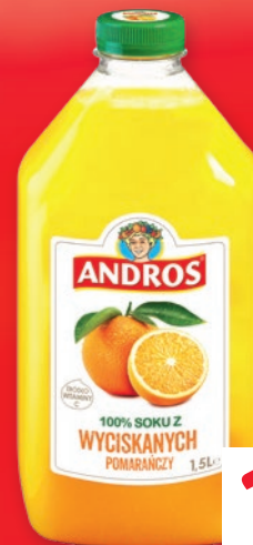
SOK POMARAŃCZOWY ANDROS 1,5 L • + kaucja 0.50 zł 698379