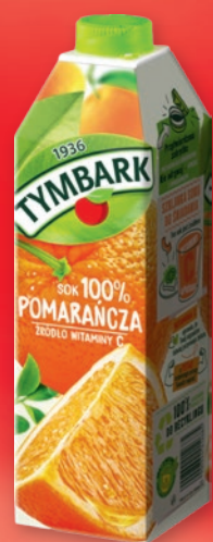
SOK POMARAŃCZOWY TYMBARK 1 L 733321