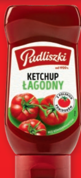
KETCHUP 440-480 G • wybrane rodzaje 275326