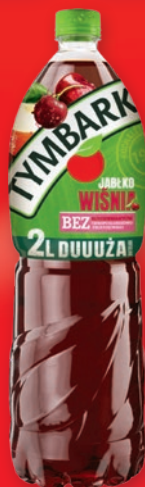
NAPÓJ TYMBARK 2 L • + kaucja 0.50 zł • wszystkie rodzaje 730832