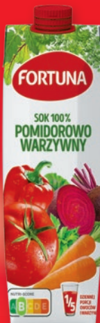
SOK WARZYWNY FORTUNA 1 L 201390