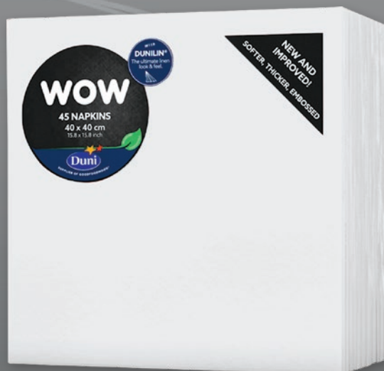
DUNI SERWETKI BIAŁE 40 x 40 CM 45 SZT. 301521