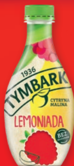
LEMONIADA TYMBARK 400 ML • + kaucja 0.50 zł • wszystkie rodzaje 733624