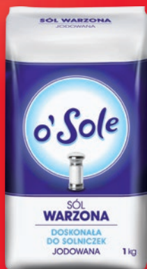
SÓL 1 KG • wszystkie rodzaje 677277