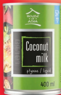
MLECZKO KOKOSOWE 400 ML 197351