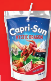
NAPÓJ CAPRI-SUN 200 ML • wszystkie rodzaje 322558