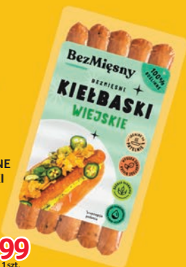
BEZMIĘSNE KIEŁBASKI WIEJSKIE 180 G 512772