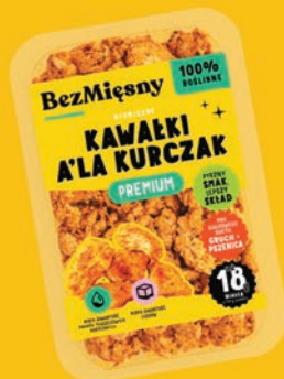
BEZMIĘSNE KAWAŁKI A'LA KURCZAK 150 G 147095