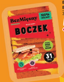
BEZMIĘSNY BOCZEK 100 G 391947