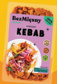
BEZMIĘSNY KEBAB 160 G 576393