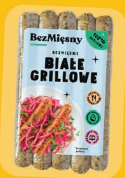
BEZMIĘSNE KIEŁBASKI BIAŁE 180 G 696937