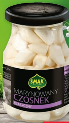
CZOSNEK MARYNOWANY 190 G • wybrane rodzaje 287901