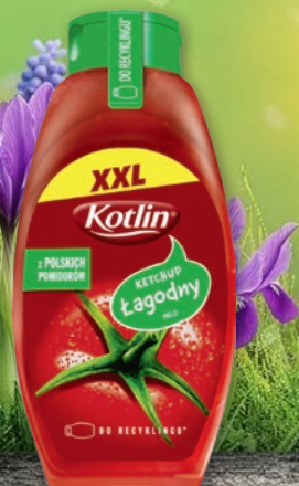
KETCHUP 950 G • łagodny, pikantny 510797