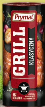
PRZYPIAWA DO GRILLA 80 G • wszystkie rodzaje 575426