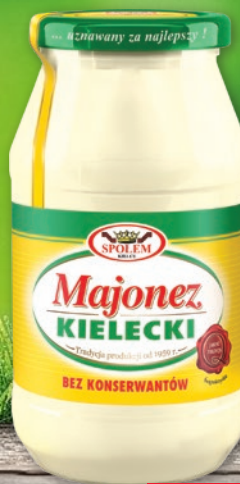
MAJONEZ KIELECKI 500 ML 596060