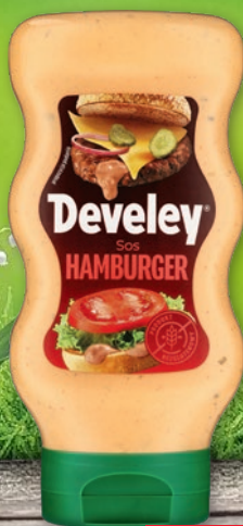
SOS 410-465 G • wybrane rodzaje 411153