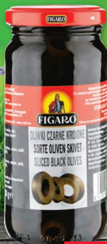
OLIWKI KROJONE 240 G • czarne, zielone 969030