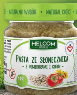
PASTY WARZYWNE 180/190 G • wybrane rodzaje 270752