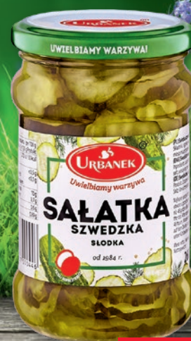
SAŁATKA SZWEDZKA 260 G 645399