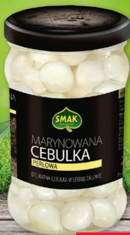
CEBULKA MARYNOWANA 290 G • perłowa, złota 573188