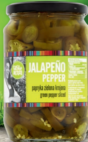
PAPRYKA JALEPENO ZIELONA KROJONA 670 G 476503