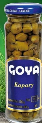
KAPARY 100/110 G • w promocji również kapary o obniżonej zawartości soli 1594