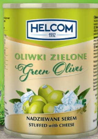
OLIWKI ZIELONE NADZIEWANE 280 G • wszystkie rodzaje 965132