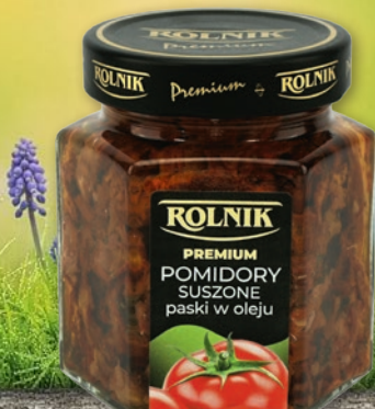
POMIDORY SUSZONE 280 G • wszystkie rodzaje 363078