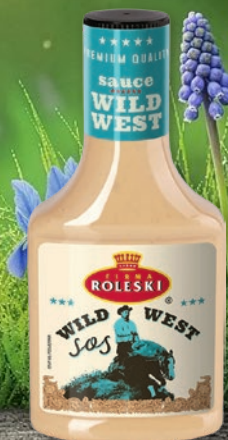
SOS 300-370 G • wszystkie rodzaje 338536