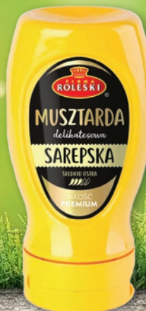
MUSZTARDA 275 G • sarepska, stolowa 361193