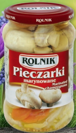
PIECZARKI 320/340 G • całe w zalewie octowej, krojone w zalewie naturalnej 568239