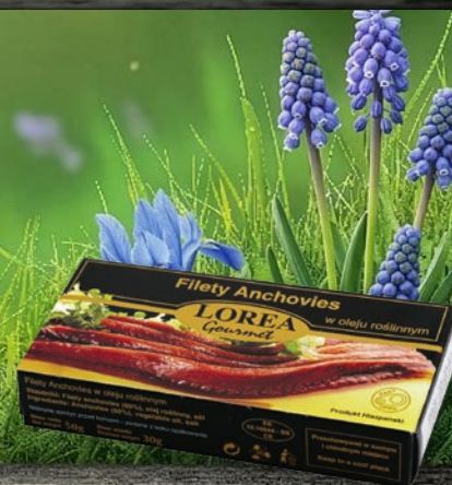
FILETY ANCHOVIES W OLEJU ROŚLINNYM 50 G 605955