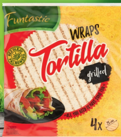
TORTILLA GRILLED 250 G 88845