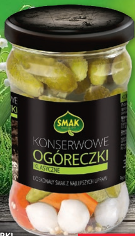
OGÓRKI KONSERWOWE KORNISZONY 300 G • wszystkie rodzaje 712290