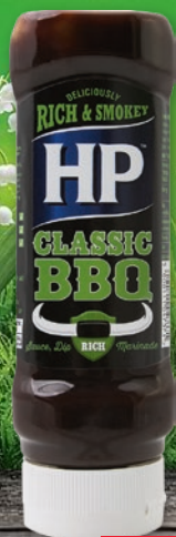
SOS DO GRILLA 465 G • klasyczny, miodowy 251587