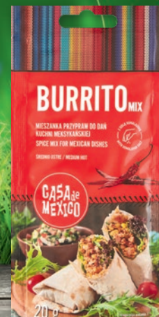
MIESZANKI PRZYPRAW 20 G • wszystkie rodzaje 651802