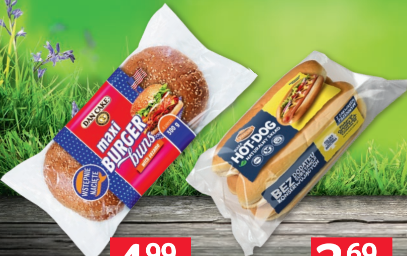
BUŁKA MAXI BURGER 300 G 649065