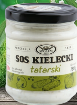
SOS 180/200 G • tatarski, czosnkowy, cygański 561360