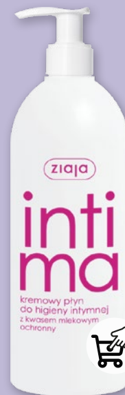
ZIAJA PŁYN DO HIGIENY INTYMNEJ 500 ML • różne rodzaje 15079973 707281