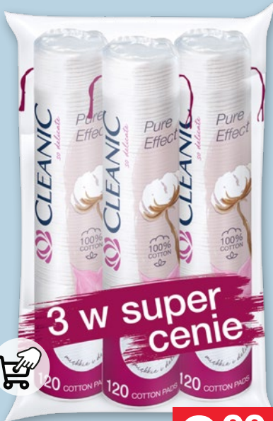
PŁATKI CLEANIC 3 x 120 SZTUK 19856897 122297