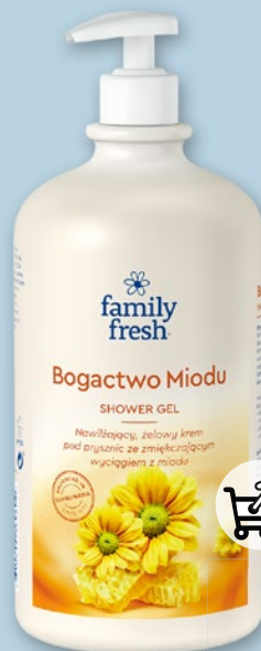
FAMILY FRESH ŻEL POD PRYSZNIC 1000 ML • różne rodzaje 85983963 645731