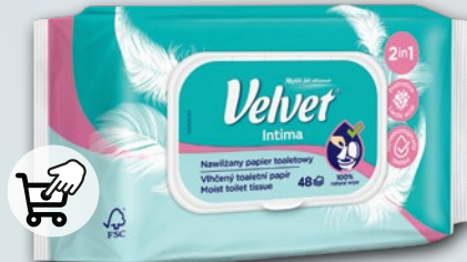
VELVET PAPIER NAWILŻANY 48 SZT. • trzy rodzaje 77175305 495650