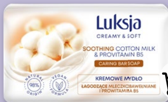
LUKSJA MYDŁO 90 G • różne rodzaje 50710821 911403