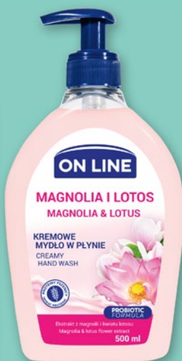
ON LINE MYDŁO 500 ML • różne rodzaje 49852346 151098