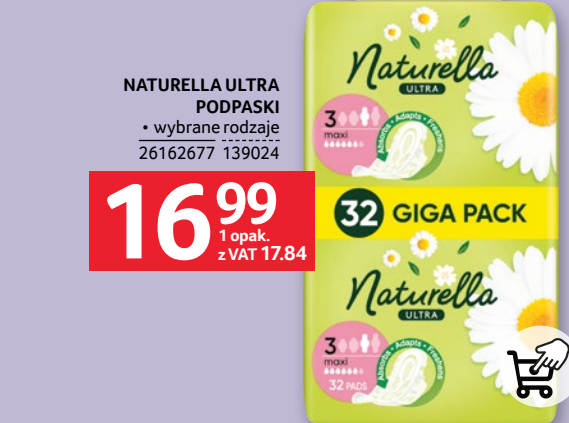
NATURELLA ULTRA PODPASKI • wybrane rodzaje 26162677 139024

To jest wyrób medyczny. Używaj go zgodnie z instrukcją używania lub etykietą.