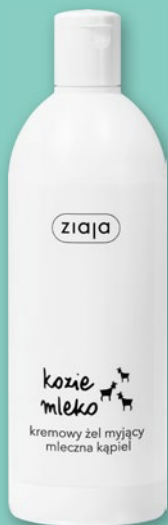
ZIAJA ŻEL MYJĄCY 500 ML • różne rodzaje 21940317 305497