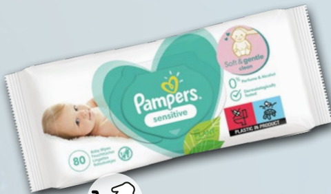
PAMPERS CHUSTECZKI • wybrane rodzaje 43004712 100902