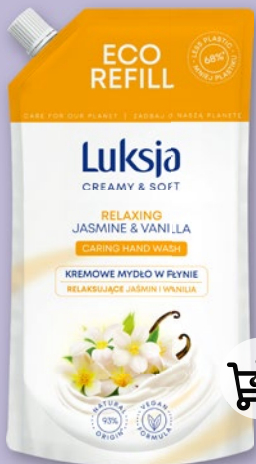
LUKSJA MYDŁO W PŁYNIE 400 ML • różne rodzaje 46225736 870495