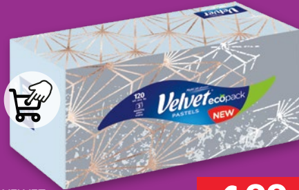
VELVET CHUSTECZKI 120 SZT. • dwa rodzaje 34947978 231721