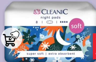
CLEANIC PODPASKI, WKŁADKI • wybrane rodzaje 50126119 974991