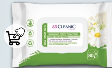
CLEANIC PAPIER TOALETOWY NAWILŻANY RUMIAKOWY 80 SZTUK 29380342 45162