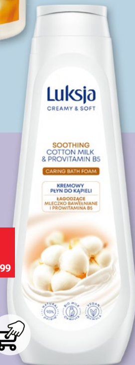
LUKSJA PŁYN DO KĄPIEŁI 900 ML • różne rodzaje 15622764 239140