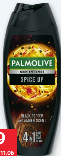
PALMOLIVE ŻEL POD PRYSZNIC 500 ML • różne rodzaje 23656549 155845