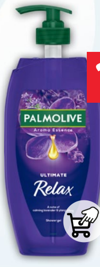
PALMOLIVE ŻEL POD PRYSZNIC 750 ML • różne rodzaje 21917224 1400