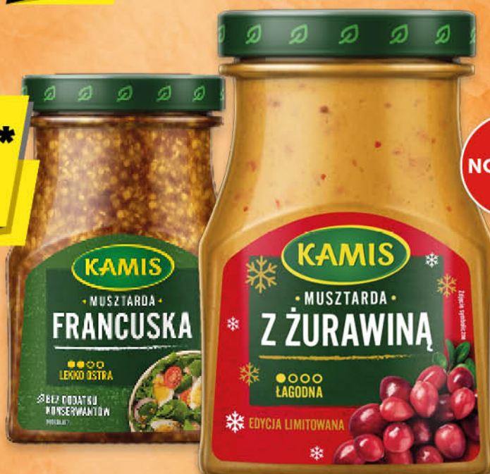
MUSZTARDA KAMIS wybrane rodzaje 185 g; 16,16 zł/1 kg *dostępne w wybranych sklepach