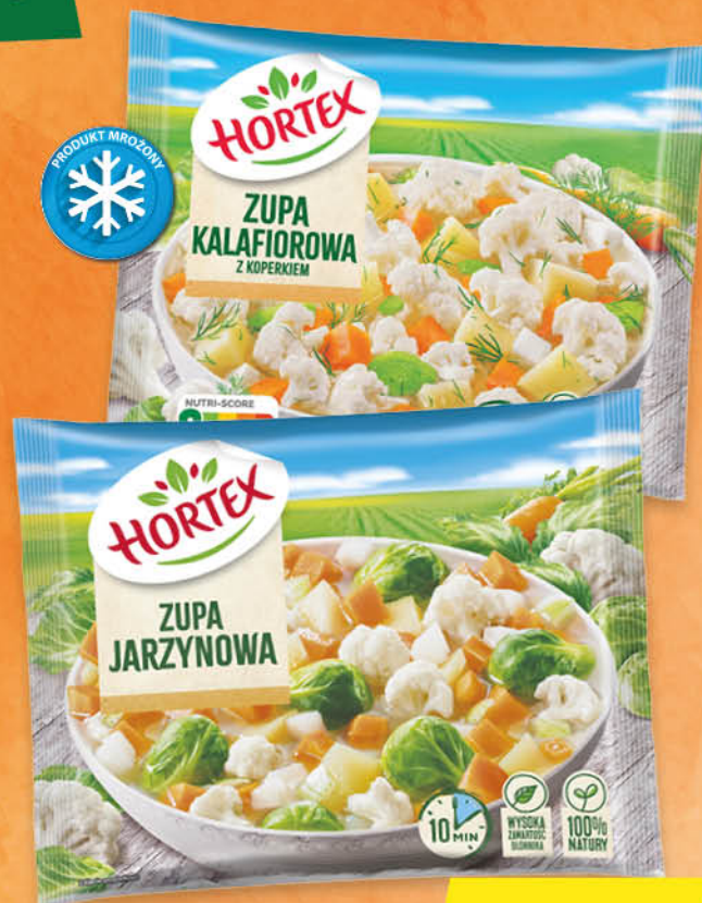
MROŻONA ZUPA HORTEX wybrane rodzaje 450 g; 16,42 zł/1 kg