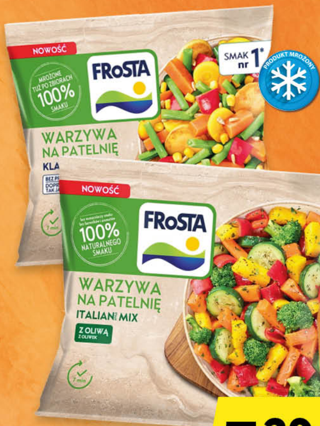
WARZYWA NA PATELNIĘ FROSTA wybrane rodzaje 400 g; 13,23 zł/1 kg